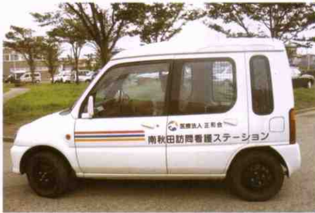
この訪問車で、ご家庭に伺います。

当ステーションは看護師三名の他、理学療法士などのリハビリスタッフも所属しています。小規模ながら、利用者の方、一人一人を大事に看護させて頂いております。また、二十四時間対応のための連絡体制も整えております。更に、医療機関が併設されており、主治医への連絡も非常にスムーズです。ご家庭で療養されている方の中で、日頃より不安をお持ちの方、介護負