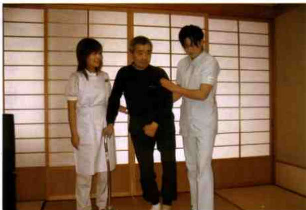
病状の観察を行い、在宅療養・リハビリのお手伝いを行います。