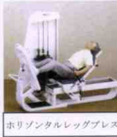
ホリゾンタルレッグプレス

上の屈伸運動を行うローイング MF は、上背部と肩後部を強化することで座位と立位時の上肢動作の向上を目的としています。他には、膝の屈伸力を強化するレッグエクステンション／フレクシオン／フレクシオン。股関節の内・外転を強化するヒップアダクション／アダクション。胸部・肩周囲を強化するチェストプレスなどがあります。 【最後に】『パワーリハ』とは、老化による動作性の低下、体力の低下を改善し、病氣・障害そのものも改善する事によって、行動全体が活発になることを目指すトレーニングとなります。 次回は、歯科衛生士による口腔ケアについてお話しします。お楽しみに。