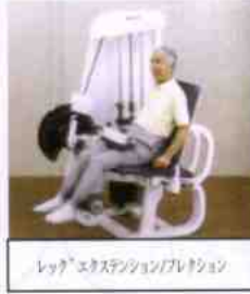
レッグエクステンション/フレクシオン