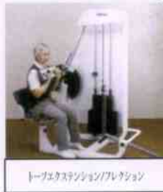
トーンエクステンション/フレクシオン

／フレクシオンは、腹筋や背筋群を強化することで立ち上がりや立位保持の動作向上を目的としています。