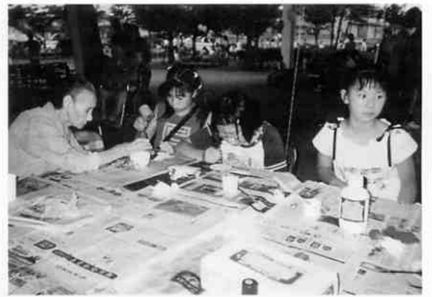
革細工体験コーナー