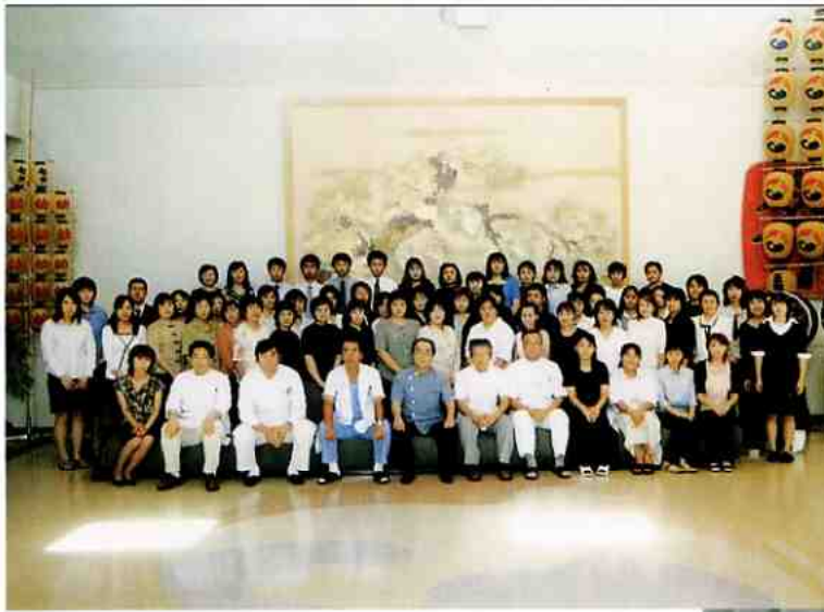
平成15年度ヘルパー講習会修了式

平成15年4月21日から2級ホームヘルパー講習会が始まり、4ヶ月以上の期間、講義・実習を経て、9月1日に59名の新しい2級ホームヘルパーが誕生しました。午後6時から8時までの2時間の講義。受講者の中には仕事・家庭を持っている方もおり、この期間は大変だったろうと思われます。しかし、皆一つの目標に向かい、真剣に指導者の話を聞き、取り組んでいる姿は印象的でした。また、ほのぼの苑・デイケア等での実習。お年寄りとのなれない会話。介護業務に携わるも、講義で実際に行う事の難しさを感じたのではないのでしょうか。 2級ホームヘルパー講習終了後、多くの方がほのぼの苑や正和会関連施設で活躍しています。今後も地域社会で活躍できる2級ホームヘルパー育成に努めていきたいと思います。また、あらためて、入所の方々のご協力に感謝いたします。