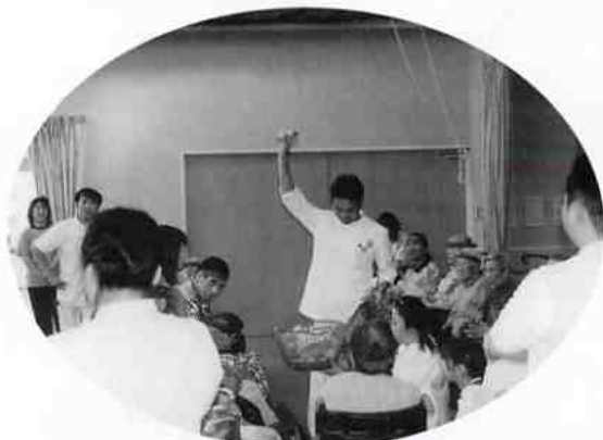
8月 ざるわたしゲーム