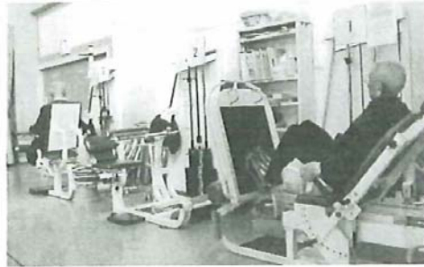
◆パワーリハビリテーションの様子

従来からのデイケアは、朝から夕方までリハビリテーション、入浴、食事、レクリエーションなどを提供してきた。今回提供を開始する短時間デイケアでは、入浴や食事は提供されず、リハビリテーションを重視したサービス内容となっており、病院の外来で行うような個別リハビリテーションを受けた人に最適となっている。もちろん、リハビリテーションは、資格をもった専門職によって行われるため、病院等で行われるリハビリテーションに引けを取らず、送迎はほのぼの苑デイケアで行われる。